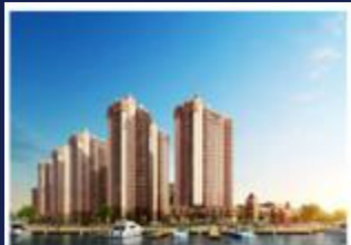
阳江奥园公园一号

从“运动就在家门口”到“构筑健康生活”，奥园形成了“体育、教育、商业综合体、健康养生、文化旅游、跨境电商”，六大主题复合地产，为消费者代理高品质的人居生活。