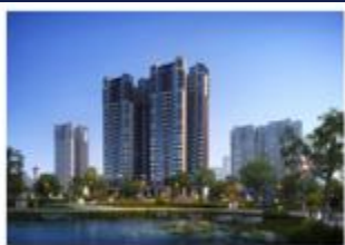
梅州奥园半岛一号