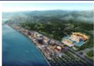
奥园文化旅游城韶关印象岭...