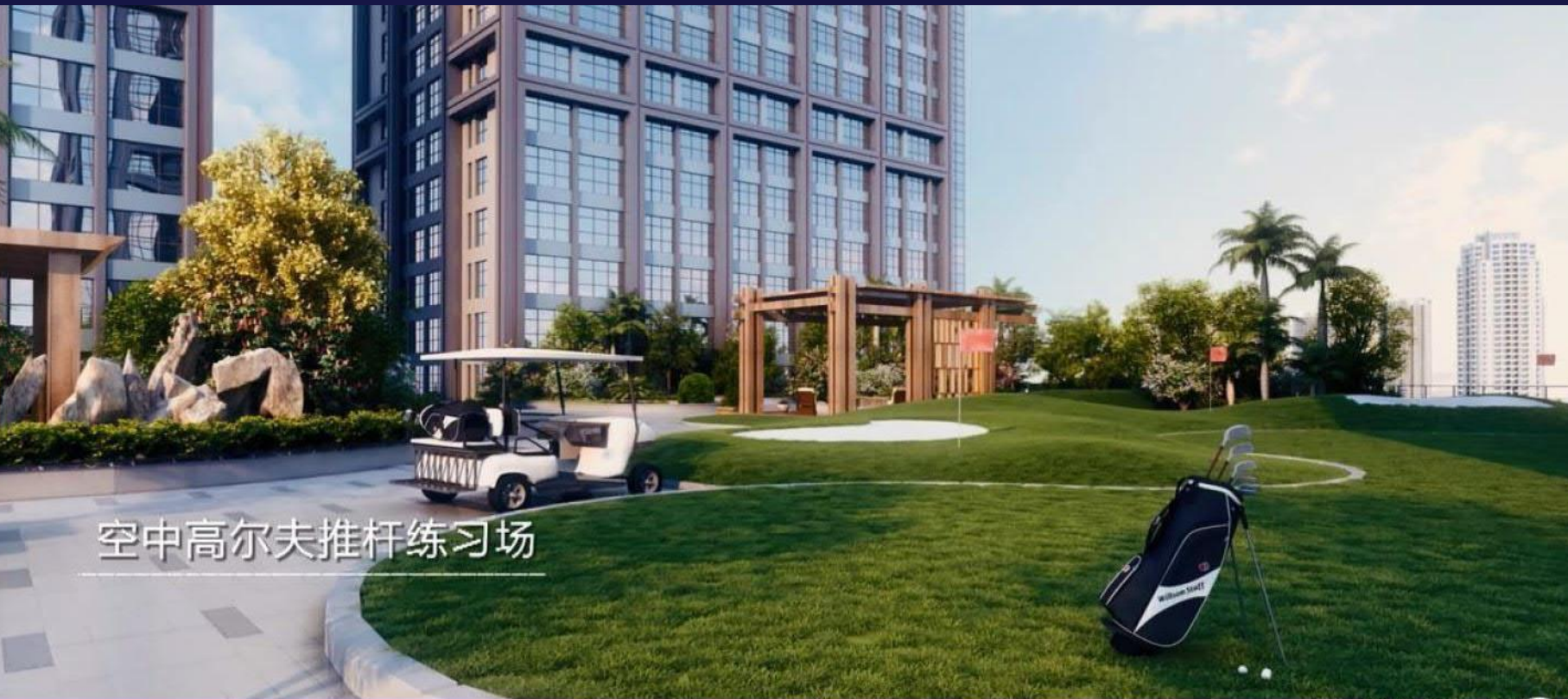
空中高尔夫推杆练习场